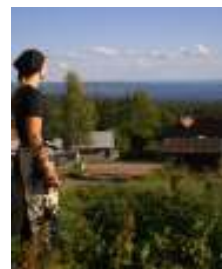
Snart på en websajt nära dig?

I början av vintern släpper vi en ny websajt som heter destinationorsa.se. Den ska drivas parallellt med orsa.se men är helt inriktad på att locka fler besökare och inflyttare (ingen "myndighetssajt" alltså). På destinationorsa.se ska du kunna läsa om vad som är på gång i Orsa. Sajten bygger på kommunikation, dialog och förändring. Läsarna kan tävla, fråga, se vackra bilder och läsa om vad som gör Orsa till en intressant boende- eller besökskommun. Eller kanske en kommun för utflyttade Orsabor att flytta tillbaka till efter några år på andra ställen i vida världen?