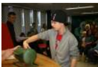
Högtidlig lottnings på Orsaskolan

Miss inte företagsmässan på Skeer 28 november! Då presenterar Orsaskolans niondeklassare 18 Orsaföretag i montrar och på scenen (Orsa Grönklitt AB, Siljan Schakt, Woodfiber Scandinavia, ASP-grunden och många fler). Möjlighet finns även att fika och äta lunch däruppe. Ta chansen och kolla in ett antal intressanta Orsaföretag och samarbete skola-näringsliv när det är som bäst!