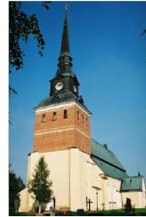
Närhet till Mora- tillgång för Orsa

I spridda kommentarer hittar man viss frustration över litenhetens nackdelar. En företagare uttrycker det som; "Ibland känns det som om vi är allas angelägenhet här...?"