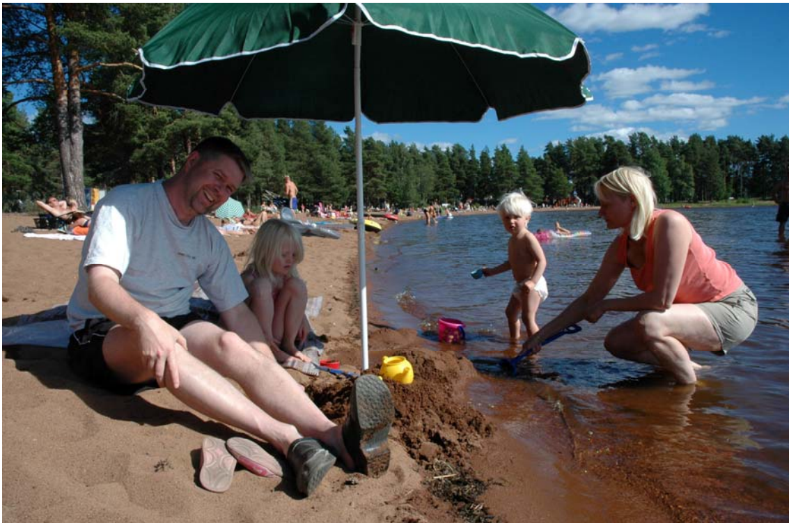
Besökare nu- potentiella inflyttare?

Att även i fortsättningen satsa på intressanta möten känns som ett viktigt spår. Både för personerna i deras roll som företagare och för dem som privatpersoner med en vilja att vara delaktig i- och kunna påverka samhällsutvecklingen.