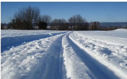
Viktig del av helheten för många

"Vi bor mycket billigare i Orsa och en del av de pengar vi tjänar på att bo här använder vi till att resa, några hotellnätter per år i Stockholm till exempel. På så sätt känns det som om vi har kapat åt oss det bästa av både Stockholm och Orsa..."