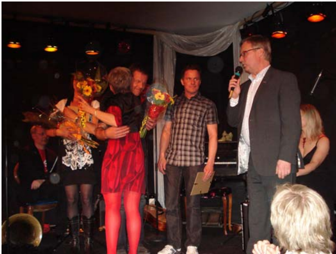
”Vi gillar roliga och spännande mötesplatser” (här Företagargala 2009)

”Vi kunde ha flyttat till London, Göteborg eller Åland, men vi ville prova något annat, bryta mönster.” ”Orsa ligger på civilisationens yttre rand, jag ville testa gränserna.” Det är två kommentarer från personer som nyligen flyttat till Orsa och startat tjänsteföretag. Den här rapporten sammanfattar intervjuer med femton personer som flyttat hit och startat företag. De har både bra och dåliga erfarenheter men trivs i huvudsak ganska bra. Vad är det då som gör att de trivs, att fördelarna överväger? Läs mer i rapporten.